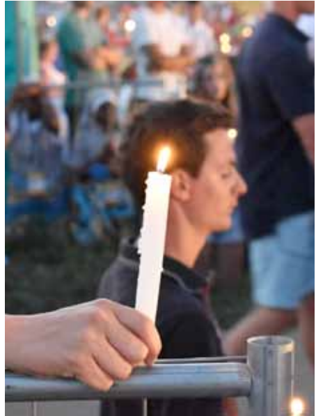
Un grupo de jóvenes diocesanos peregrinaron, a mediados del pasado mes de julio, a la JMJ de Cracovia

En fin, otro testimonio, agradecía la generosa acogida de las familias polacas: “Algo que me sorprendió mucho fue el hecho de que las familias que nos acogieron, sin conocernos de nada y tan sólo teniendo en común con ellos la religión católica, nos ofreciesen todo lo que tenían, nos cuidasen y se preocupasen por nosotros (o al menos las familias que a mí me acogieron) como si de hijos suyos se tratase”.